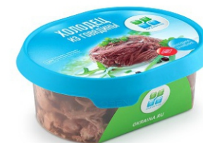
Холодец из говядины